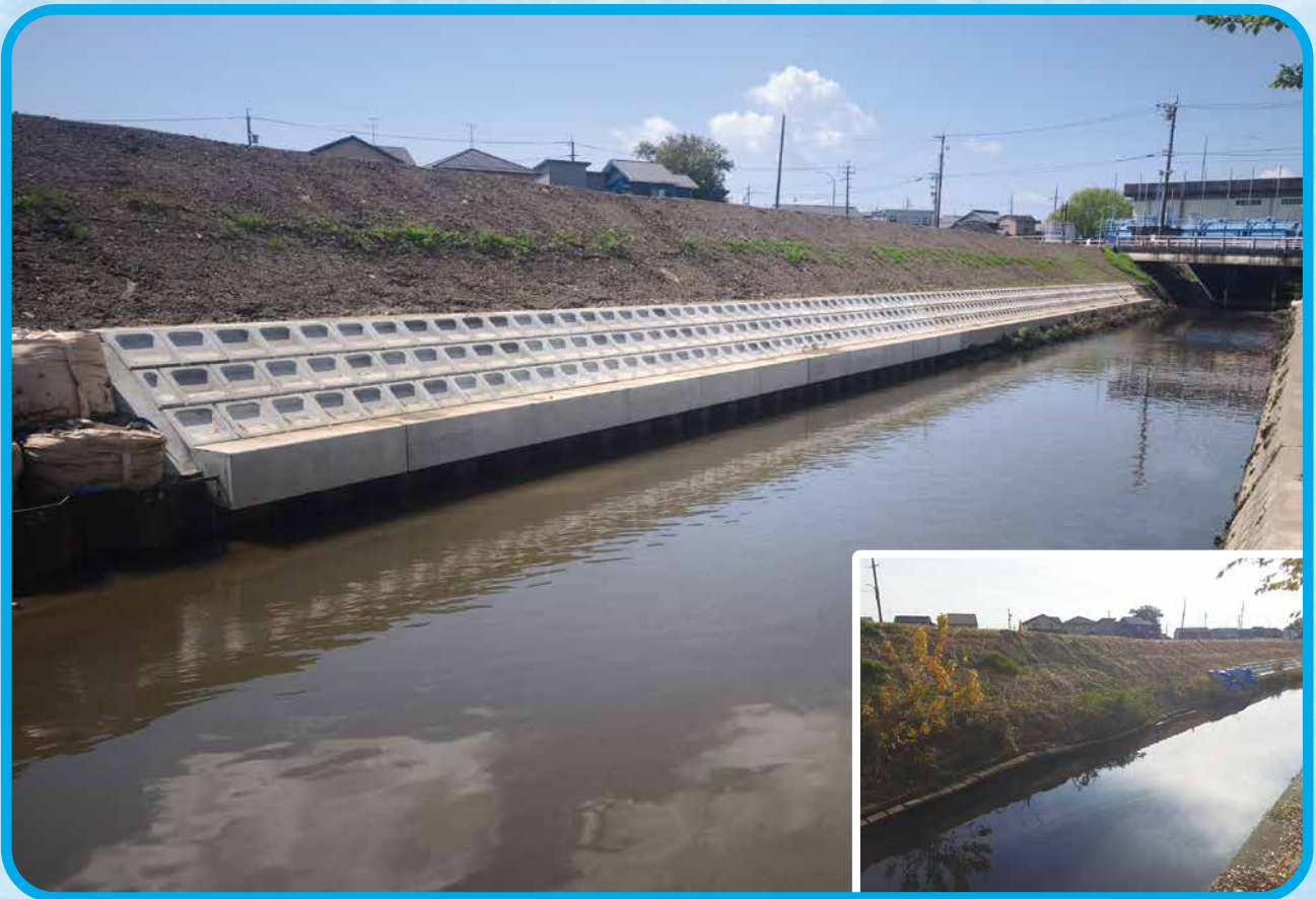
写真／県単足近排水路左岸中流護岸改良工事