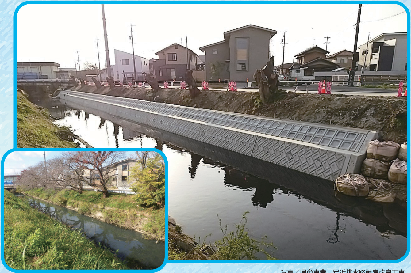
写真／県単事業 足近排水路護岸改良工事