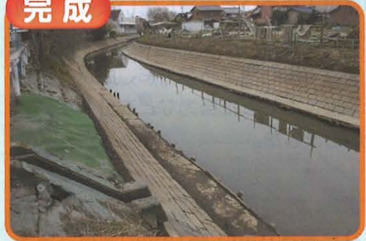
三ツ目放水路護岸修繕工事