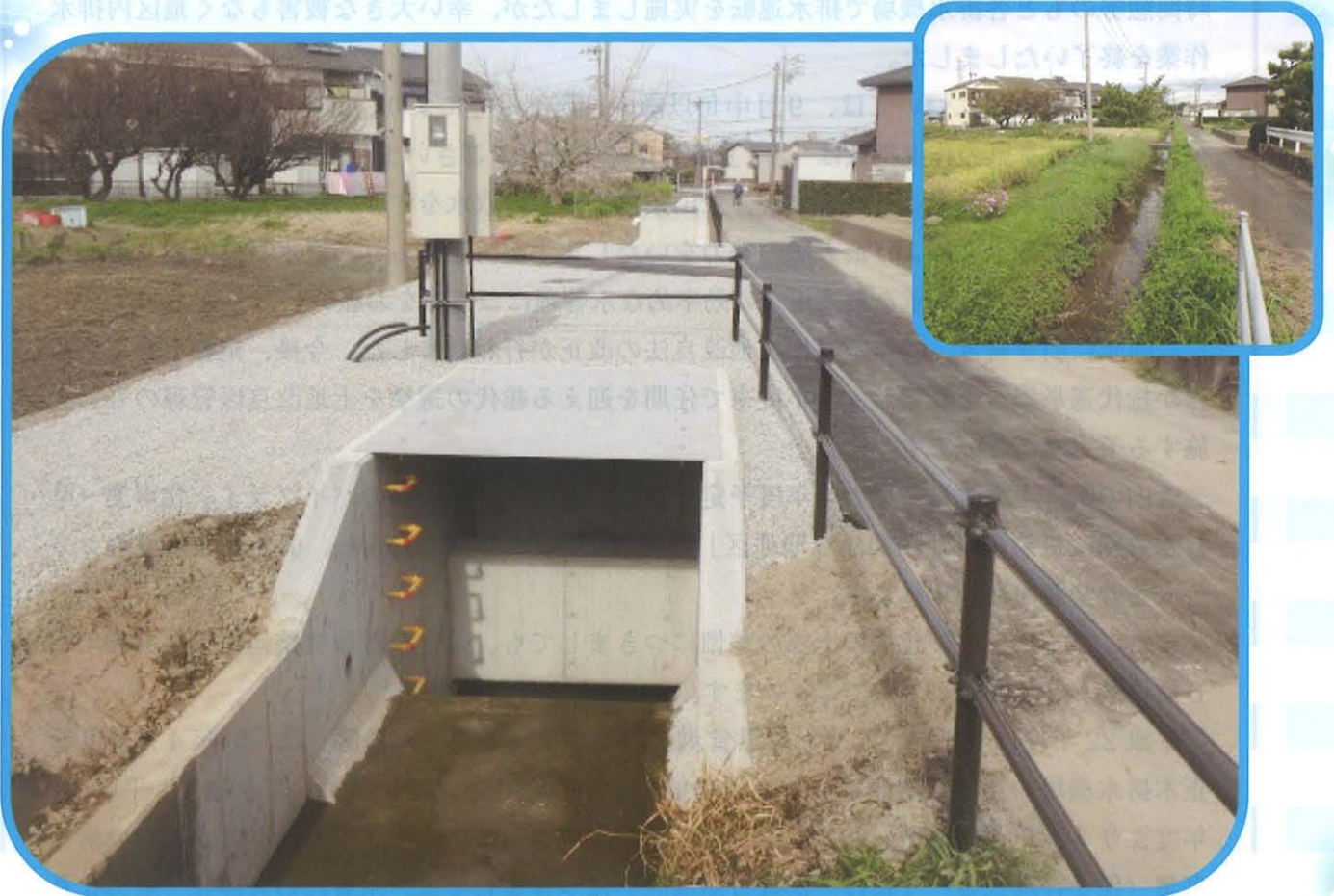
県営水質保全対策事業「羽島6期地区」(西幹線用水路：羽島市足近町南之川地内)