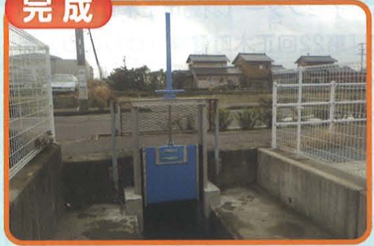
適正化事業 逆川排水機場除塵設備塗装工事